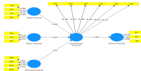
Gambar 3 Model Struktural

Model struktural berfungsi untuk menghitung keterkaitan atau hubungan variabel penelitian yang satu dengan variabel penelitian lain. Model struktural terdiri dari hubungan variabel secara langsung, hubungan variabel secara mediasi dan koefisien determinasi.