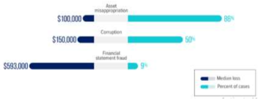
Sumber : Occupational Fraud 2022 : A Report to the Nations

Terdapat kasus kecurangan laporan keuangan yang terdeteksi di Indonesia baru-baru ini. Dilansir dari cnbcindonesia.com , berdasarkan hasil investigasi dari PT. Ernst & Young (EY) dalam laporan “Hasil Investigasi Berbasis Fakta” menemukan bahwa AIS telah melakukan tindakan kecurangan pada tahun 2019 silam. Hasil dari audit investigasi tersebut antara lain adalah adanya penggelembungan dana ( overstatement ) sebesar Rp 4 triliun pada akun piutang usaha, persediaan, dan juga aset tetap, sebesar Rp 662 miliar pada akun pendapatan, dan Rp 329 miliar pada EBITDA (laba sebelum bunga, pajak, depresiasi, dan amortisasi) dari entitas bisnis. Fakta lain ditemukan adanya aliran dana sebesar Rp 1,78 triliun kepada pihak yang terafiliasi yang diduga dengan manajemen lama (Wareza, 2019).